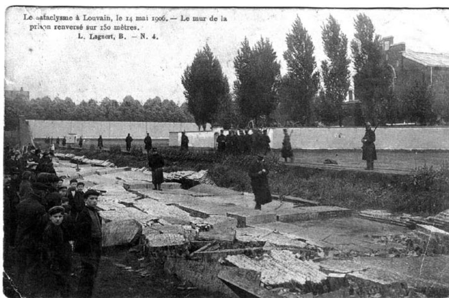
postkaart van de ingestorte buitenmuur - 14 mei 1906

Wordt de tijdspanne tussen 1860 en de eerste wereldoorlog wel eens voorgesteld als de periode waarin het afzonderingsregime werd gevestigd en geconsolideerd, dan doorbrak de sociaal woelige tijd van de negentiende naar de twintigste eeuw op een bijzondere manier de routine in Leuven Centraal. Wegens hun rol in quasi revolutionaire manifestaties in de lente van 1886 werden de 'ophitsers' Falleur en Schmidt veroordeeld tot twintig jaar dwangarbeid en opgesloten in de centrale gevangenis. Om te voorkomen dat de passies onder de arbeiders wegens het lot van hun gevangenen kameraden nog zouden oplaaien en men een eventueel overlijden in de gevangenis wilde vermijden – voor het leven van Schmidt werd gevreesd – stelde toenmalig minister van Justitie Lejeune alles in het werk om de betreffende gedetineerden vrij te krijgen. Het waren uiteindelijk zij, samen met de anarchistische leider Wagener en nog een aantal veroordeelden naar aanleiding van de onlusten, die konden genieten van de eerste voorwaardelijke invrijheidstellingen. Lejeune zelf had in Leuven met de gedetineerden een gesprek en zette als het ware persoonlijk voor hen de gevangenispoort open. Vandaar dus de aanleiding voor een versnelde realisatie van de wet inzake de voorwaardelijke invrijheidstelling, waarvan Leuven Centraal het decorum vormt. 14