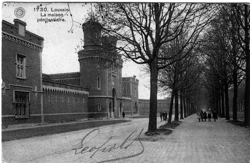
voorgevel Leuven Centraal anno 1908