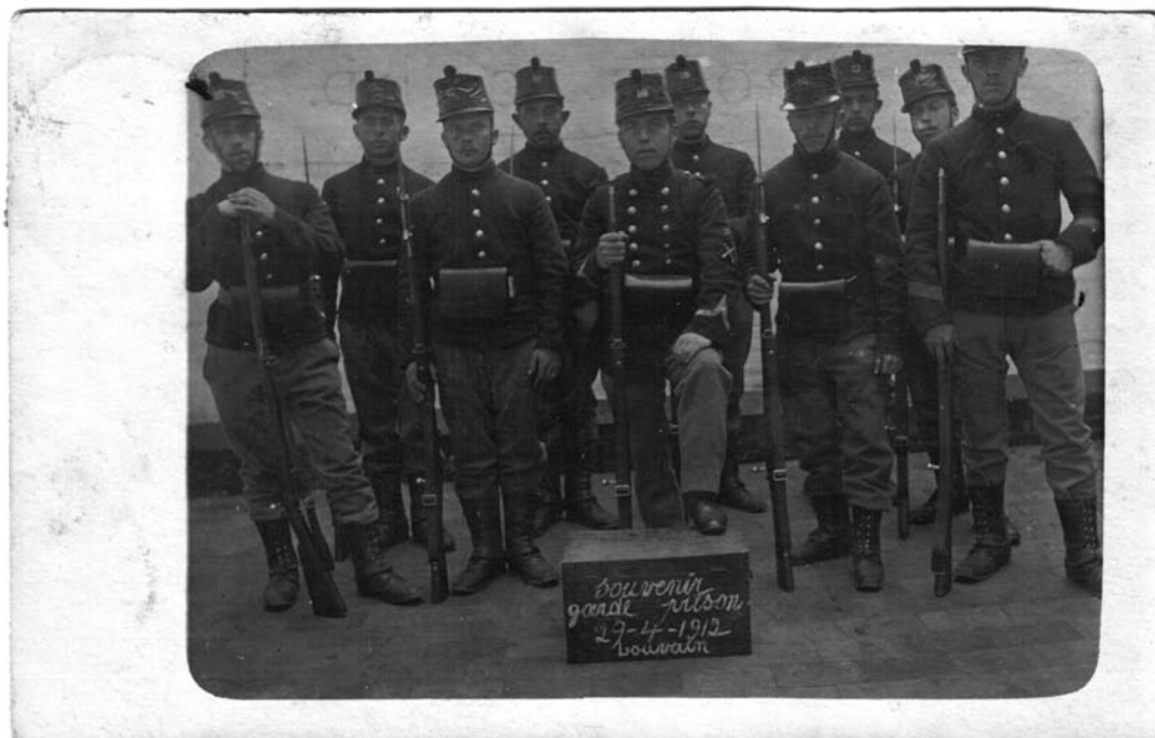
'garde prison' van Leuven Centraal anno 1912

Op de vraag waarom een dergelijk beleid wordt ontwikkeld, kan een eenvoudig antwoord worden gegeven. Dit beleid krijgt gestalte omdat gedetineerden mensen zijn en alle mensen nu eenmaal waardevol zijn . Zo simpel is dat. Laten wij dit in onze penitentiaire praktijk evenwel nooit vergeten.