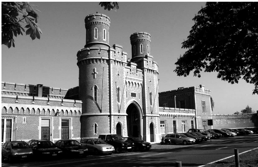
voorgevel Leuven Centraal anno 2005