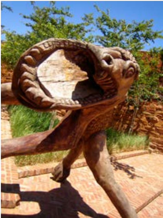
'The Angry Godzilla'

hij twee arresten in het bijzonder, met name de mijlpaalarresten waarin respectievelijk de doodstraf ( De Staat tegen Makwanyane , 1995) en het verbod op het homohuwelijk ( Minister van Binnenlandse Zaken tegen Fourie , 2005) ongrondwettig werden verklaard.